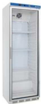
Frio Comercial - Armarios refrigerados en ABS - Armarios expositores - Refrigerados puerta de cristal